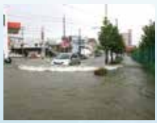
▲国道171号周辺の浸水被害

西宮市中央部を南北に流れる津門川の流域は、これまでも豪雨による浸水被害が度々発生してきました。周辺住民の皆さんの暮らしを守るため、大雨のときに津門川に流れてきた水を、直径約5mの地下パイプに貯留し、浸水の被害を抑えるための工事を進めています。