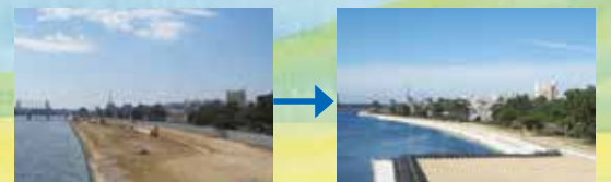
▲流路拡幅工事前(平成28年) ▲工事後(平成29年)

武庫川では、災害に負けない安全な地域づくりのため、河川の幅を広げる流路拡幅工事や掘削工事など、さまざまな治水対策を実施しています。