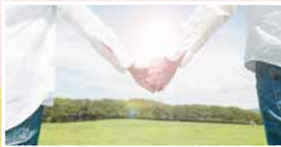
障害の有無にかかわらずの男女の出会いの場づくり「バリアフリー恋活」