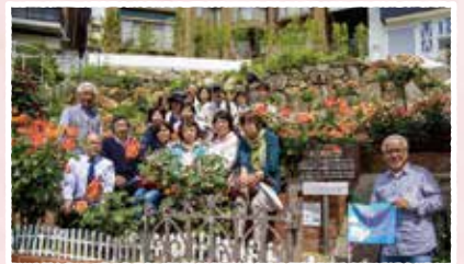
まちの魅力を訪ねるツアー