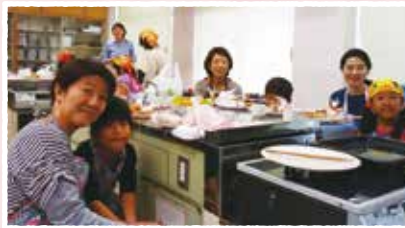
ハロウィン親子料理教室