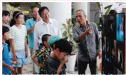
植物や昆虫の写真展とギャラリートーク