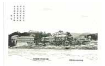
古茂江海岸 四州園 絵葉書