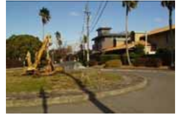
古茂江海岸地区の町並み