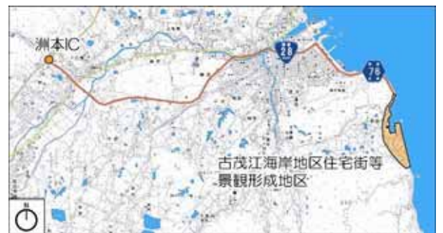
地図出典：国土地理院発行 2万5千分の1地形図

神戸淡路鳴門自動車道洲本 IC 下車、国道 28 号線を東に進み、県道 76 号線を南下、車で約 30 分。