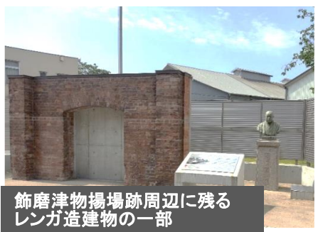
飾磨津物揚場跡周辺に残るレンガ造建物の一部