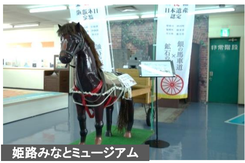
姫路みなとミュージアム