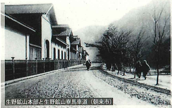
生野鉱山本部と生野鉱山寮馬車道 (朝来市)