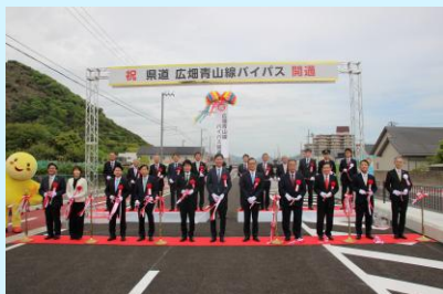
令和8年4月26日 開通式典