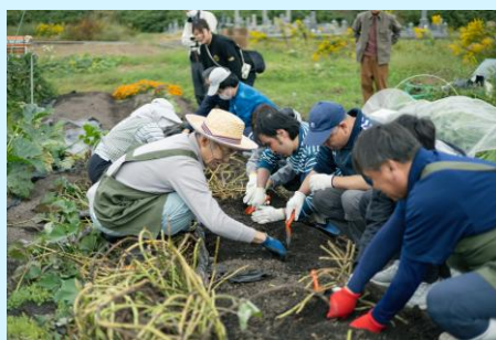
ユニバーサル農園