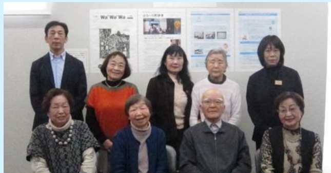
会議後に全員で記念撮影をしました。

令和8年2月24日に開催しました生活創造応援隊会議にて、長年に渡る生活創造活動への支援にご尽力いただいた生活創造応援隊員の皆様へ感謝状を贈呈しました。隊員の方々からいただいたメッセージを掲載します。