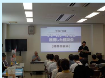
先輩からのメッセージ