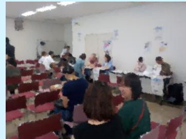
各ブースに分かれ、フリースクール 毎の相談会の様子