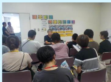
各ブースに分かれ、県立施設の 相談会の様子