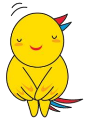
兵庫県マスコット はびたん