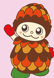
高砂市マスコットキャラクター ほっくりん