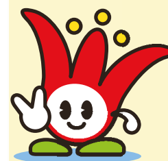
加古川市シンボルキャラクター ウェルビー