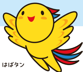
兵庫県マスコット はばたん