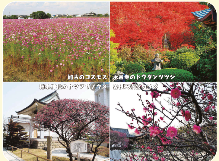
加古のコスモス 柿本神社のヤブササノメ