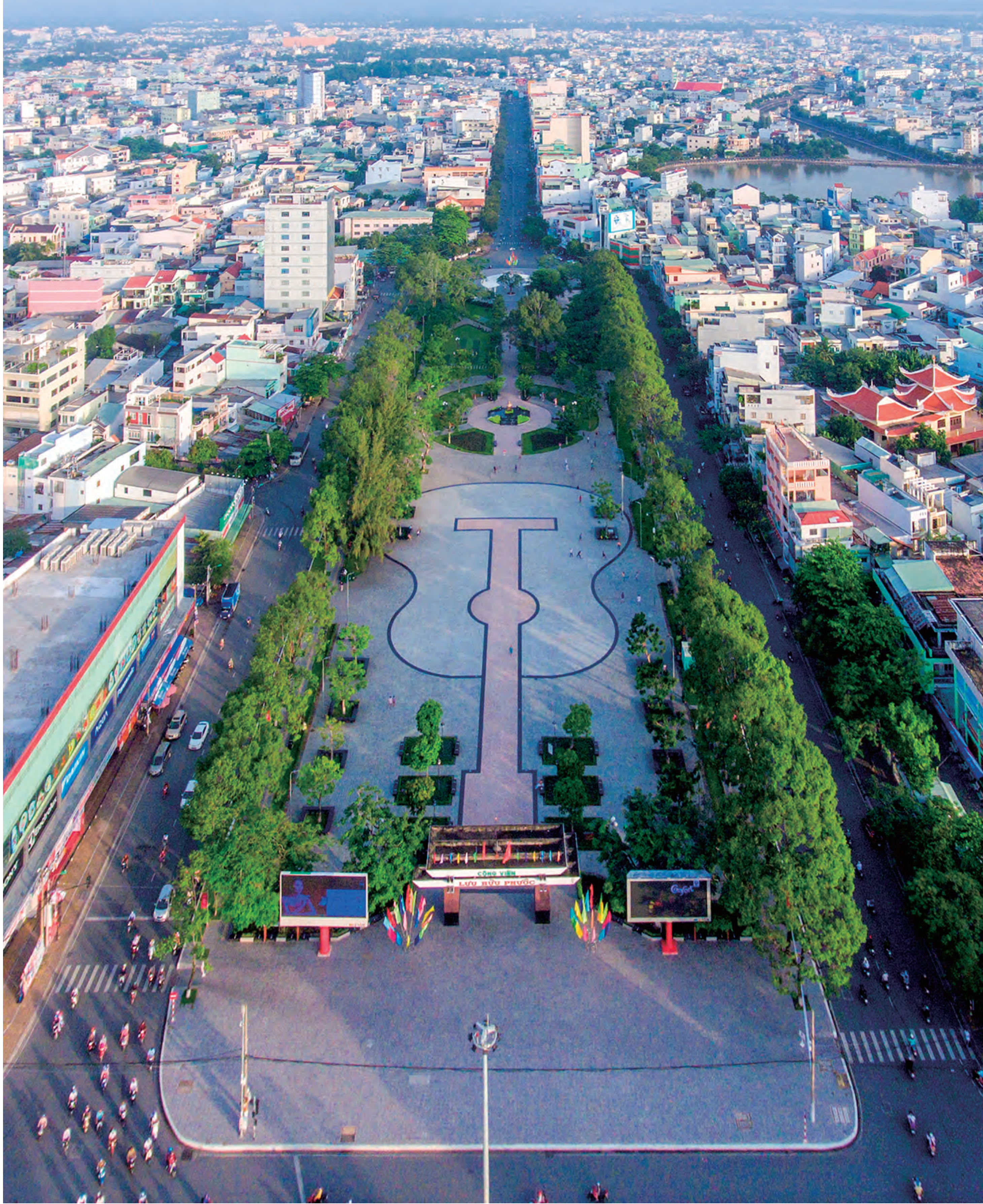
カントー市街地 Can Tho city landscape