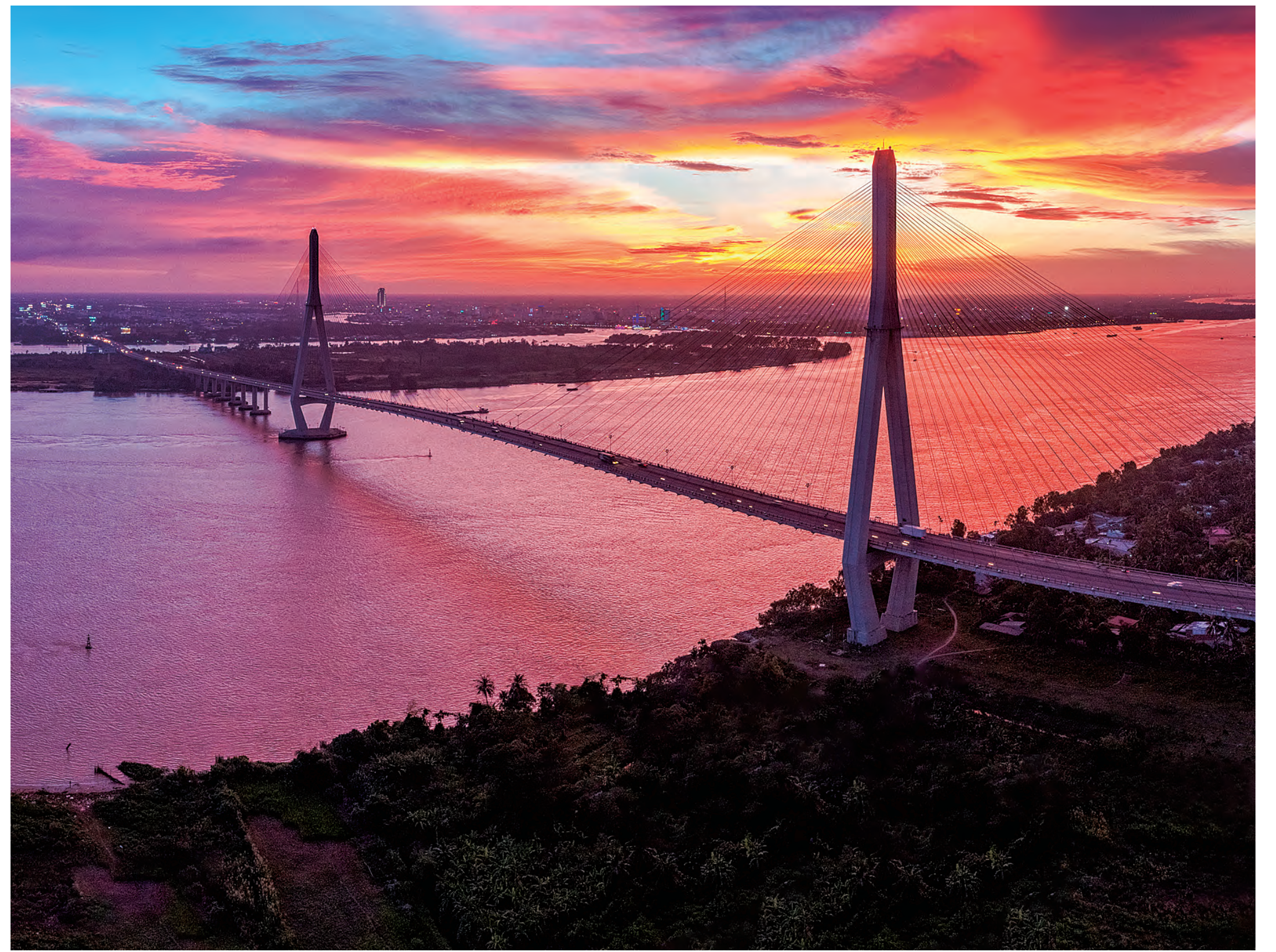
日本のODAで架けられたカントー橋 Can Tho Bridge built with ODA from Japan