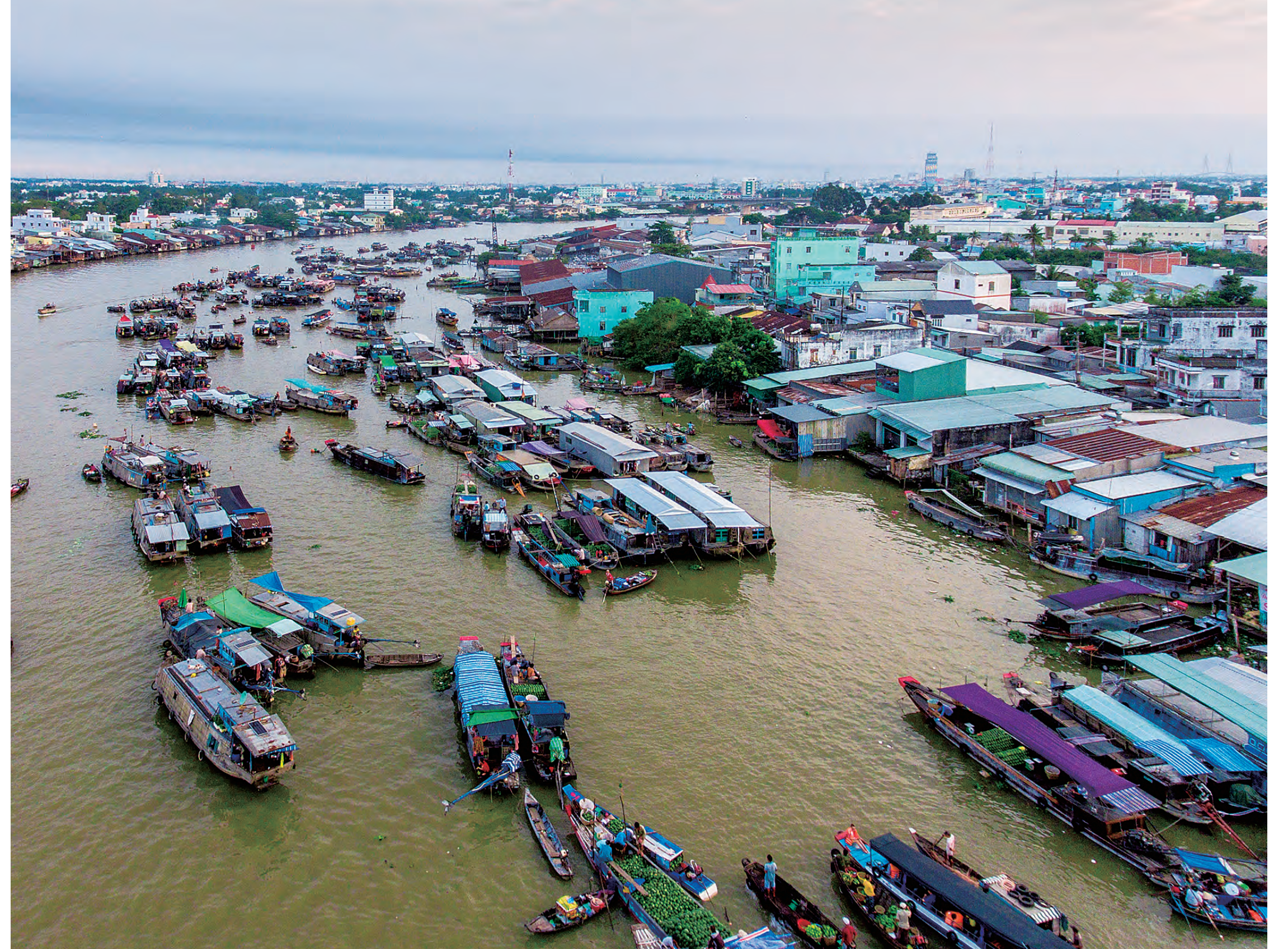
早朝開かれるカイラン水上マーケット Cai Rang floating market early in the morning