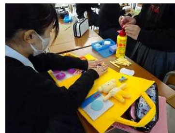
玩具製作(相生産業)

農業、商業、水産、家庭、福祉科教員の専門技術・技能 の質的向上と教育力向上のために、技能伝承講習会を実施