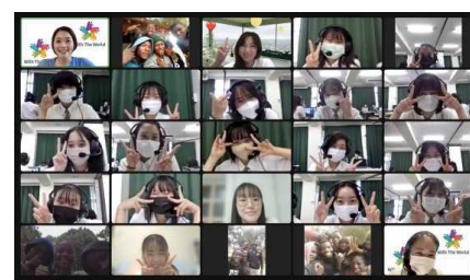
(オ) オンライン国際交流(国際)