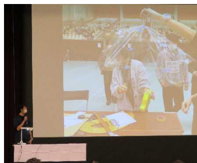
決勝(実技競技 プレゼンの様子)