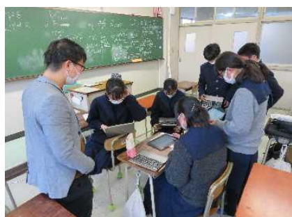
(ア) 京大-HGLC 科学者育成プログラム(北摂三田)