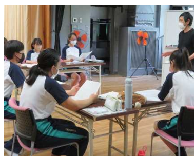
(カ) 劇作・演出に取り組もう(宝塚北)