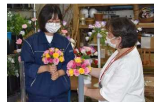
フラワーアレンジメント(有馬)