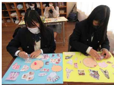
生徒の自己肯定感を高める授業 (伊和)

※重層的支援・・・「すべての児童生徒の発達を支える生徒指導」(第1層)、「課題の未然防止をねらった生徒指導」(第2層)、「深刻な問題への発展を防ぐ生徒指導」(第3層)、「特別な指導・援助を必要とする特定の児童生徒を対象とした生徒指導」(第4層)の4層からなる支援