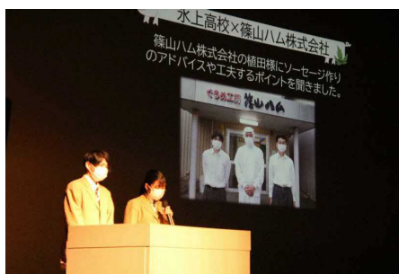
(エ) 加工食品の商品化(氷上)