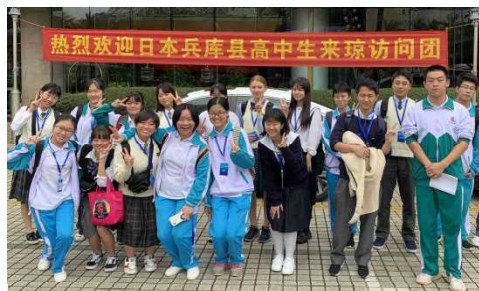
中国・海南省との高校生交流事業(R1)