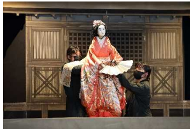
淡路人形浄瑠璃(淡路三原)