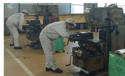
フライス盤作業(飾磨工業)