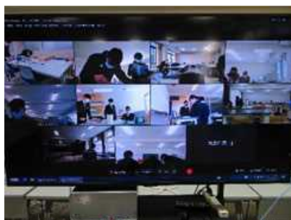
オンラインを活用した実験(神戸)