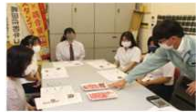
地域企業と連携し、地元の特産物を使った商品開発(社)