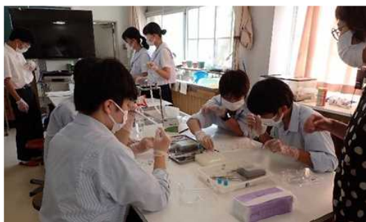
DNA抽出実験(尼崎小田)