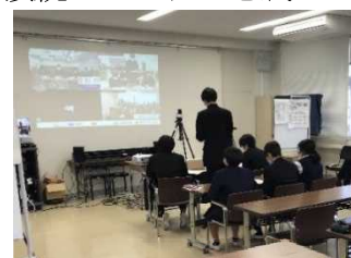
3校合同ダイアログ大会