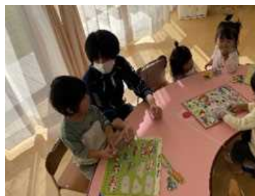
よりよい人間関係を築く力を育む授業 (上郡)