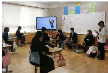
(キ) 「対人援助」の授業(阪神昆陽)