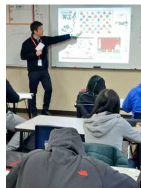
ワシントン州への教員派遣事業(R1)