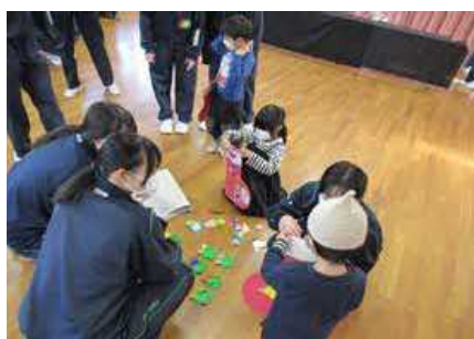
(ウ) 地域福祉実践(神戸北)