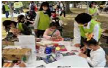
「防災すごろく」で地域の子どもたちと交流(武庫荘総合)

(イ) 取組内容 高校生が独自の視点で兵庫の魅力を考察し、自治体や企業等に提案した地域活性化策の具現化