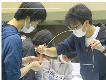
決勝(実技競技 作製の様子)