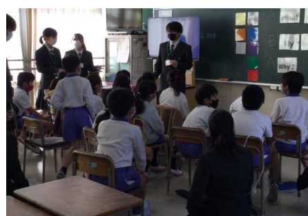
(イ) 小学校英語出前授業(明石城西)