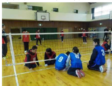
舞子高校と視覚特別支援学校の交流及び共同学習