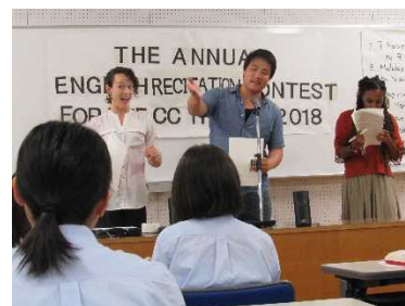
スピーチコンテスト（尼崎小田）