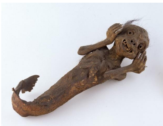
1. 人魚 ライデン国立民族学博物館蔵