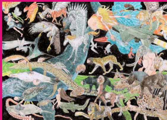
五十嵐大介「異類の行進(マーチ)」2019 ©五十嵐大介