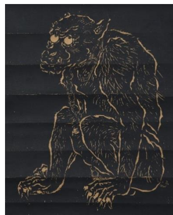
無支祈図(むしきず) 個人蔵