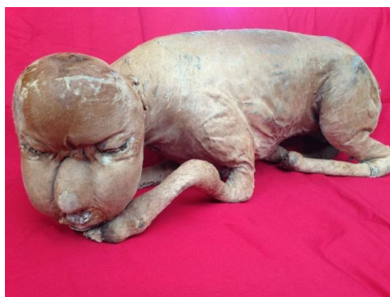
4. 件（くだん）の剥製 個人蔵