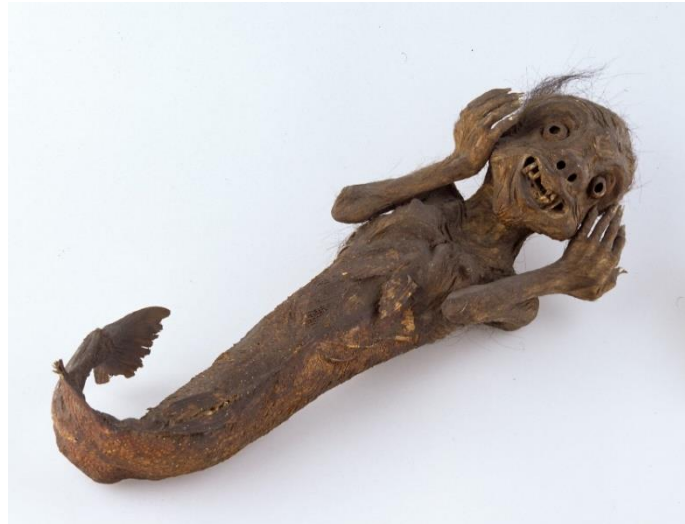
人魚 ライデン国立民族学博物館蔵