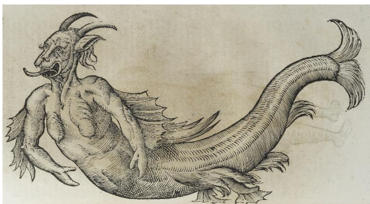
3. 『怪物誌』 国立民族学博物館蔵