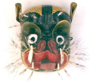
8. 虎仮面 (タイガー・マスク) 国立民族学博物館蔵