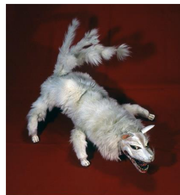
淡路人形 九尾の狐 兵庫県立歴史博物館蔵