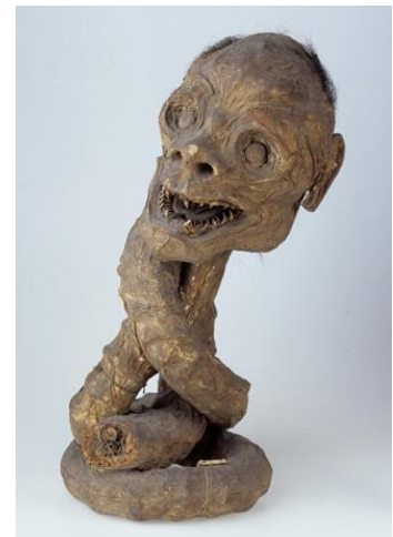
9. ろくろ首 ライデン国立民族学博物館蔵 Collection Nationaal Museum van Wereldculturen. Coll. no. RV-360-4740