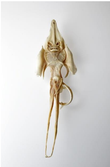
7. ジェニー・ハニヴァー 個人蔵