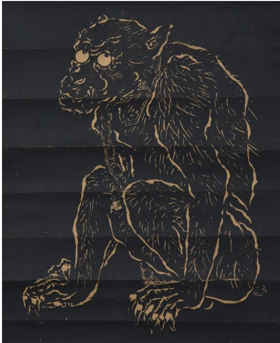
5. 無支祈図 (むしきず) 個人蔵