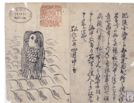
肥後国海中の怪(アマビエの図) 京都大学附属図書館蔵