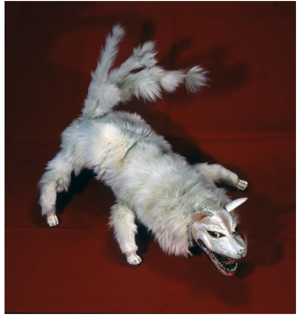
6. 淡路人形 九尾の狐 兵庫県立歴史博物館蔵