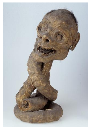
ろくろ首 ライデン国立民族学博物館蔵 Collection Nationaal Museum van Wereldcul- turen. Coll. no. RV-360-4740