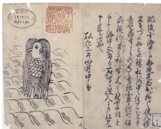
2. 肥後国海中の怪（アマビエの図） 京都大学附属図書館蔵