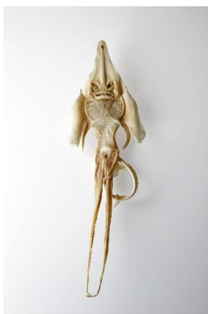
ジェニー・ハニヴァー 個人蔵