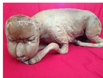
件(くだん)の剥製 個人蔵