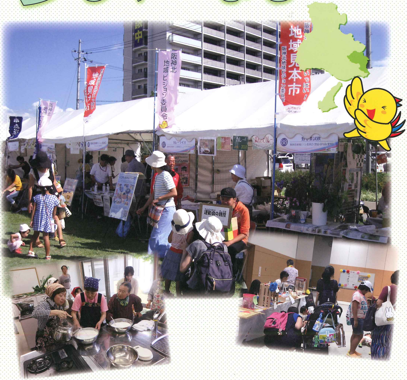
中央：地域見本市、左：第2回エコツアー、右：パパママフェスタ、右下：企画調整部会