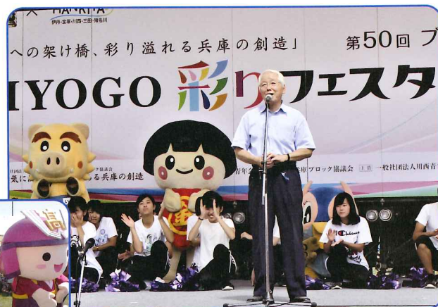
川西市のキャラクター「きんたくん」(左)と川西明峰高校のキャラクター「めいぼん」(右)→