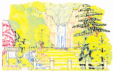
自然とのふれあいゾーン 丁字が湯