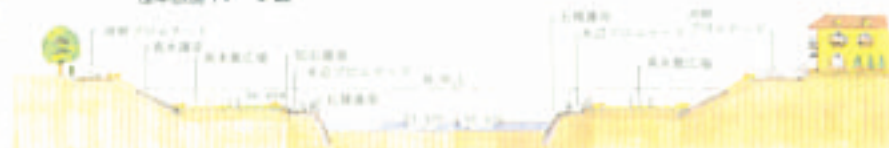
親水アメニティゾーンの標準断面イメージ図