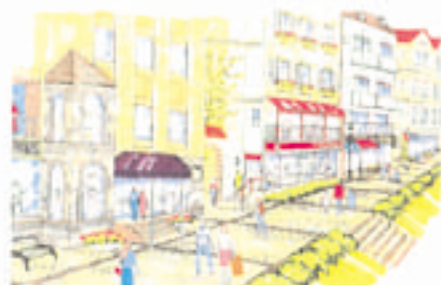
親水アメニティゾーン リバーサイド生活文化ブロック