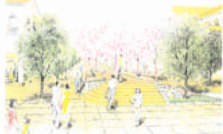
シンボルゾーン 花山道