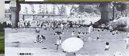
S29年ごろの武庫川下流

河川管理者 都市の河川部局 都市部局等 の連携協働的取組が重要 武庫川を中心とした 県・市の連携・協働的取組が重要 + 地域住民の参画と連携・協働