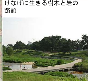
仁川合流点付近下流右岸