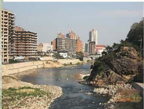
見返り岩と宝塚中心