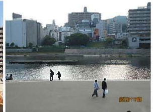
日陰のない高水敷と対岸の 錯綜した都市景観景観