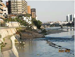
けなげに生きる樹木と岩の 路頭