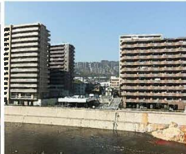
マンションの林立