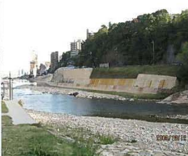
災害復旧工事の護岸景観