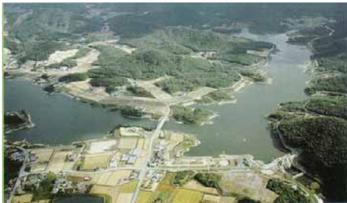
写真 1 青野ダム