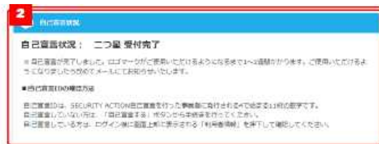
自己宣言状況確認

※上記画面の表示方法については、操作方法マニュアル対象箇所：p.8～14 参照。