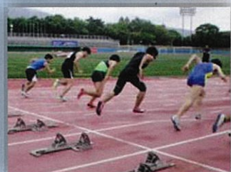
スタートダッシュ練習

医師、理学療法士、義肢装具士等との連携のもと、選手の総合的・継続的なサポートを実施しています。