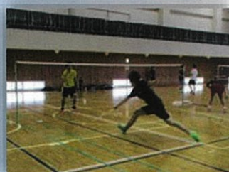
フットワーク練習