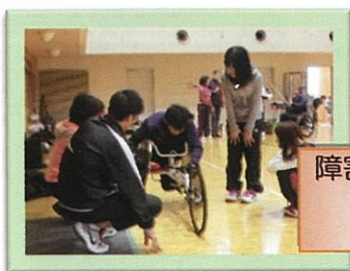
障害者スポーツ指導者 講習会の様子 (28年度)