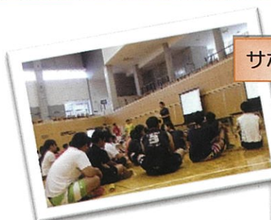
サポーター養成講座の様子