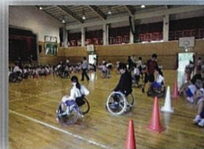
車いすバスケット