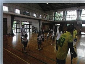
アンプティサッカー

小中学校や地域スポーツクラブ等を対象に障害者アスリートによる出前講座を実施しています。