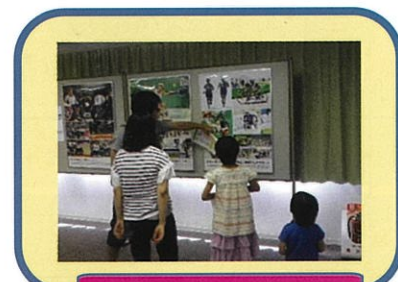
高砂市総合体育館