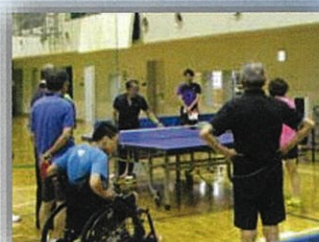
コーチによるルール確認と指導