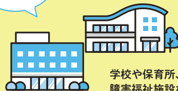
学校や保育所、 障害福祉施設など 関係機関