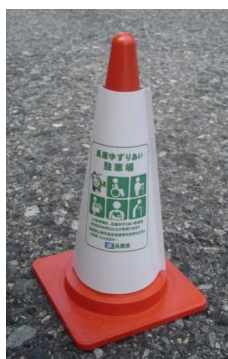
【駐車場での設置例】