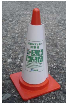
【駐車場での設置例】