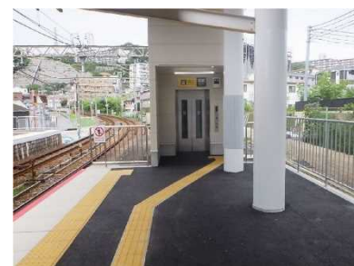
□鉄道駅におけるエレベーター設置