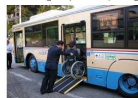
□ノンステップバス