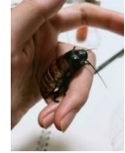
マダガスカルオオゴキブリ