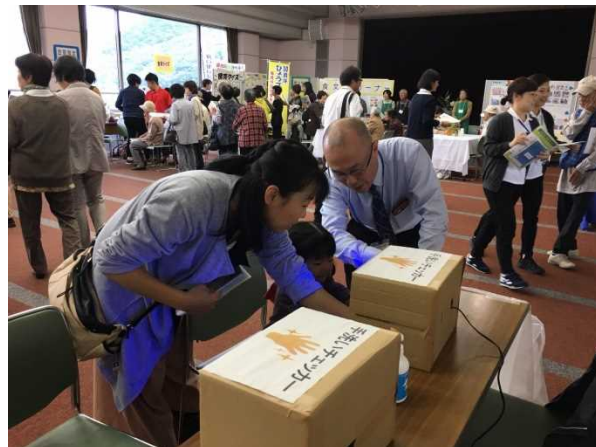
食の安全安心フェアの様子