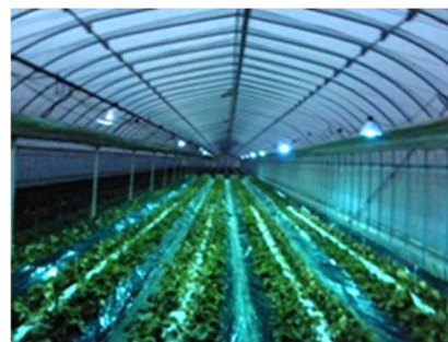
紫外線照射による病害虫防除

生産活動に由来する環境への負荷を低減するため、環境創造型農業を推進し、化学合成の肥料及び農薬の低減技術等（環境創造型農業技術）の普及拡大を図る。さらに、生産物に対する消費者の信頼度向上、生産者と流通・販売業者の連携強化や県民の理解促進に努める。