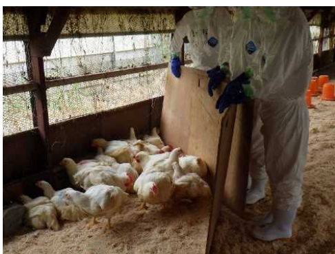
鳥インフルエンザモニタリング検査