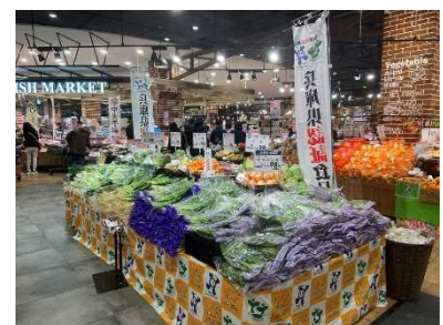
認証食品販売コーナー

安全・安心で個性・特長のある県産食品を県が現地調査や安全性検査、生産履歴記帳等により確認して認証する「ひょうご食品認証制度」を推進し、県民が安心して県産食品を購入できるよう認証食品の生産・流通・消費の拡大を図る。