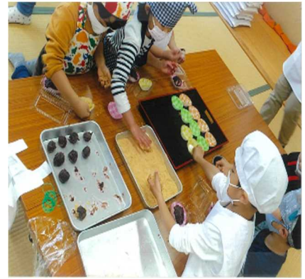
レシピの例 (おはぎ)