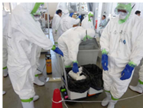
鳥インフルエンザ発生に備えた防疫訓練