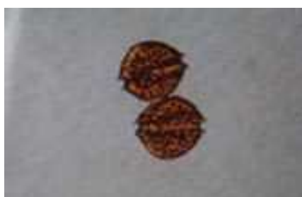
貝毒原因プランクトンの一種 (大きさ 1 mm の 1/30)