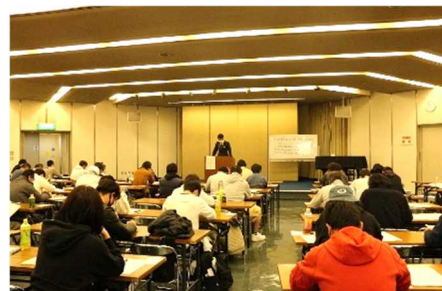
農薬管理指導士認定特別研修

農薬の取り扱いについて指導的役割を果たす農薬管理指導士を育成し、農薬による事故防止や農薬の安全かつ適正使用を進める。