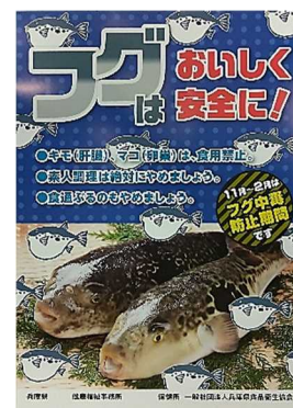
フグ中毒防止ポスター