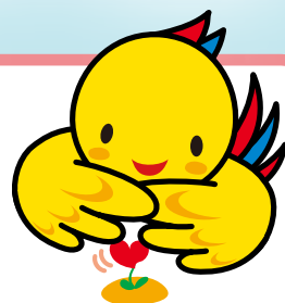
兵庫県マスコット はぼタン