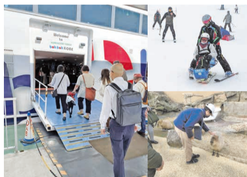
自然体験等障害者の特性に応じたテーマ別のツアーを展開します。

さまざまな人が気兼ねなく旅行を楽しめるユニバーサルツーリズム(UT)を推進。UTコンシェルジュなどの人材育成や、宿泊施設に対するソフト・ハード両面からの支援等を行います。