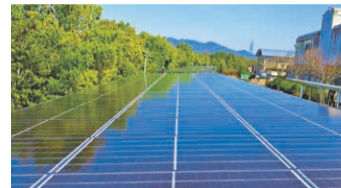
PPA方式により県広域防災センター(三木市)に導入した太陽光発電設備。

県内中小企業の敷地等に太陽光発電設備等を整備し、電力供給を行うPPA事業者を支援。また、生産・製造過程等でのCO 2 排出量を見える化するカーボンフットプリント(CFP)を活用した取り組みを促進し、CFPを用いた商品選択等の普及啓発を実施します。