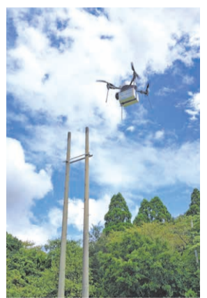
ドローンによる物資搬送のイメージ。

物資搬送分野でも研究開発が進むドローンを活用し、災害発生時の速やかな被災者支援や物資搬送等の実証実験を実施します。また、県内の防災関連施設と観光資源を組み合わせたモニターツアー等を実施します。