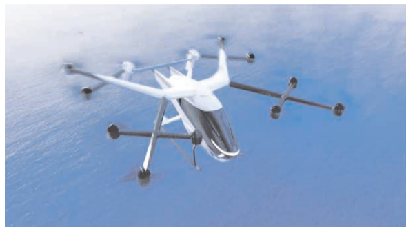
開発中の空飛ぶクルマのイメージ。

2025年大阪・関西万博の開催に向け、飛行ルートや利用シーンの検討、離着陸候補地の抽出・選定、民間による事業開発への支援等を進めます。