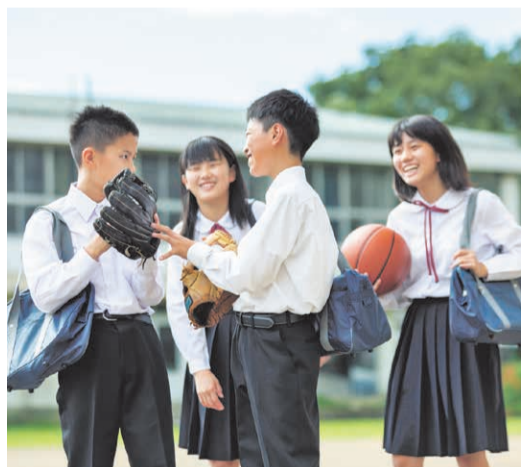
2028年度までの6年間で約300億円を集中投資し、環境整備を進めます。

選択教室や体育館の空調整備等、県立学校の環境を充実させます。また、東播磨地域の特別支援学校の狭隘化対策として、建て替え、増築や新設校の設置を行います。さらに、国際的視野を育む教育を強化するための検討会の設置や私立高等学校等生徒の授業料軽減の支援拡充も行います。