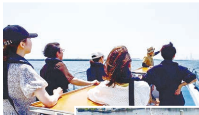
尼崎運河クルーズ