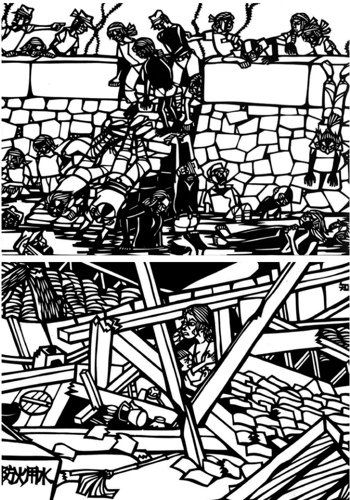
被爆直後の人々の様子を描いた切り絵。

●株式会社潮書房光人新社 ☎03-6281-9891 ☎03-6281-9893