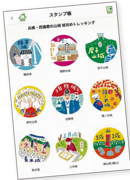
2022(令和4)年度版のスタンプ帳画面。