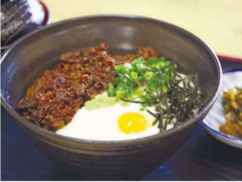
イノシシの肉とすりおろした山の芋をかけた「猪肉とろろ丼」。

六甲山は開拓から130周年を迎えました。10力所以上の登山口があり、初心者から健脚向けまで多様な登山道が整備されています。神戸県民センターでは、22のコースの特徴を距離や所要時間と共に紹介する「六甲山ハイキングマップ」をウェブ上で公開していますので、自分の体力に合ったコースで山歩きを楽しんでください。11月は有馬温泉近くの紅葉谷や、西宮市北部の蓬莱峡の紅葉が特にきれいですよ。(神戸県民センター県民課)