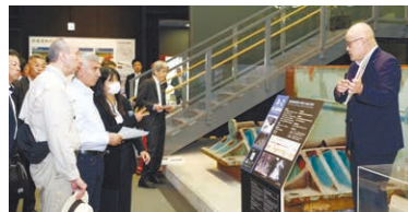
午前中は震災関連施設などを見学して回りました。

トルコ 1999年のトルコ北西部地震の際に兵庫県民からの義援金を原資に「ひょうごトルコ友愛基金」を設立。奨学金プロジェクトを展開し、親を亡くした子どもたちを支援してきました。その後も兵庫県と防災・文化交流を続け、2023年2月のトルコ・シリア地震後は、土木工学などを学ぶ被災県出身の大学生に奨学金を支給。卒業後の都市防災力強化への貢献が期待されています。