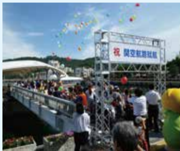
関西国際空港への定期航路が就航した洲本港。港のにぎわい創出事業を展開

淡路島の強みである観光業に磨きをかけるため「日本のはじまり淡路島」観光情報発信事業や「パリ“ジャポニスム2018”での淡路島プロモーション事業」を展開。「神戸新開地・喜楽館」の淡路島出張公演や「神戸淡路鳴門自動車道全通20周年記念事業」などのイベント開催で交流人口の拡大を狙います。