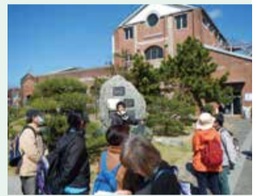
移住希望者のための「移住ガイドツアー」を開催

「永田秀次郎の人生」ドキュメンタリー映像制作支援事業や淡路人形浄瑠璃特別公演(パリ、西宮)などにより、ふるさと意識の醸成を図ります。また、「鳴門の渦潮」世界遺産登録に向けた取り組みを推進します。