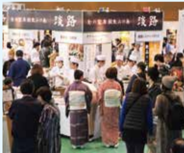
昨年、淡路島で開催された「御食国・和食の祭典」

御食国ブランドの確立を目指す「御食国淡路島」推進戦略を展開。淡路島のタマネギやレタス、果物、和牛など農畜水産物のブランド力を強化。産業の活性化を進めます。