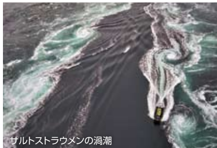
サルトストラウメンの渦潮