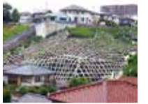
崩壊防止工事 (北区鈴蘭台西町)

土砂災害から人命や財産を守るため、急傾斜地崩壊防止工事で砂防えん堤の施設整備を推進します。さらに表六甲山麓への施設整備や防災樹林の整備など六甲山系グリーンベルト整備事業に取り組んでいます。 ☎神戸土木事務所公園砂防課 ☎078(737)2164 ☎078(735)1362