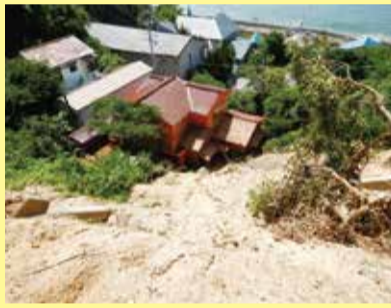
土砂が崩れた急傾斜地