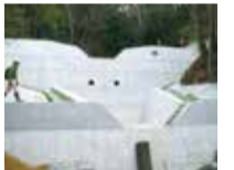
治山ダム(北区有野町)

森林を保全し、土砂流出等による山地の荒廃を防ぐため、台風災害による崩壊斜面の復旧や計画的な治山ダム等の設置に取り組んでいます。さらに、定期的な危険地区のパトロール、既設治山施設の点検、地元住民への危険箇所の説明などを行っています。 ☎六甲治山事務所 ☎078(361)8573 ☎078(361)8579