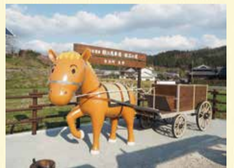
*手綱を引いたあとは、しっかり手洗いをしましょう

☎銀の馬車道ネットワーク協議会 ☎079(281)9059 ☎079(222)8573