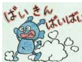
「ばいきんばいばい」