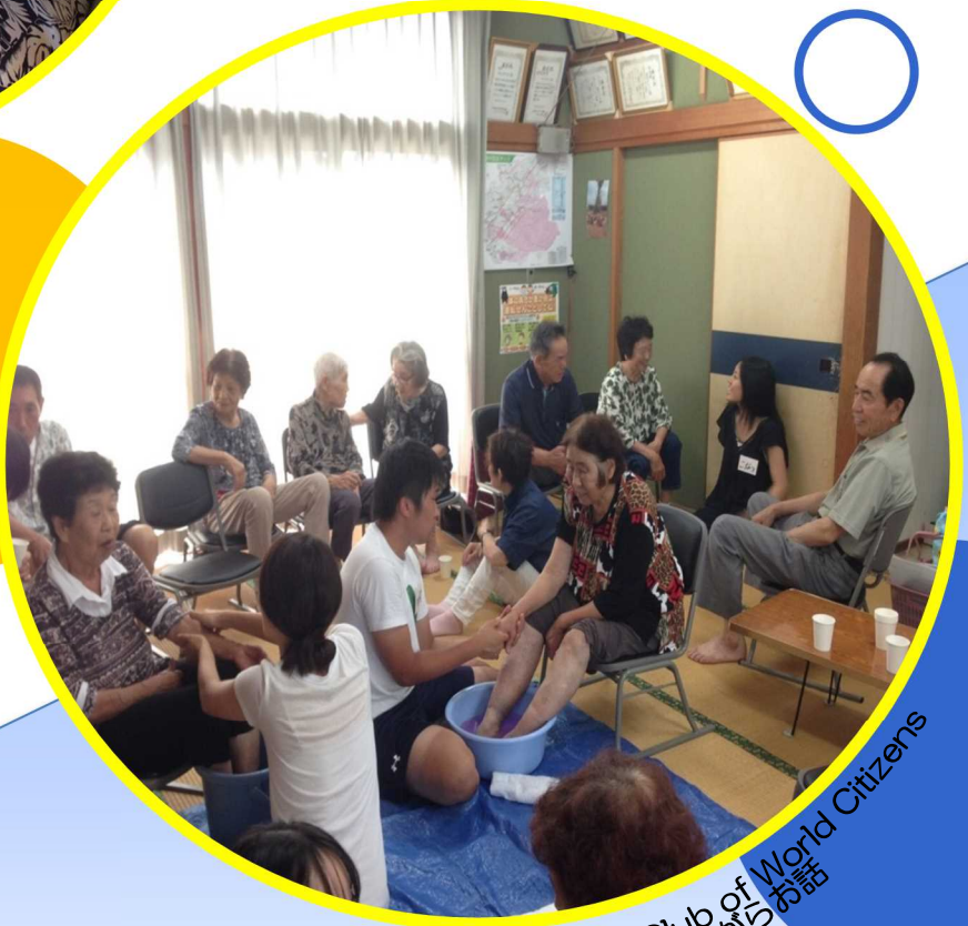
関西学院大学 Club of World Citizens 避難所で足湯をしながらお話し