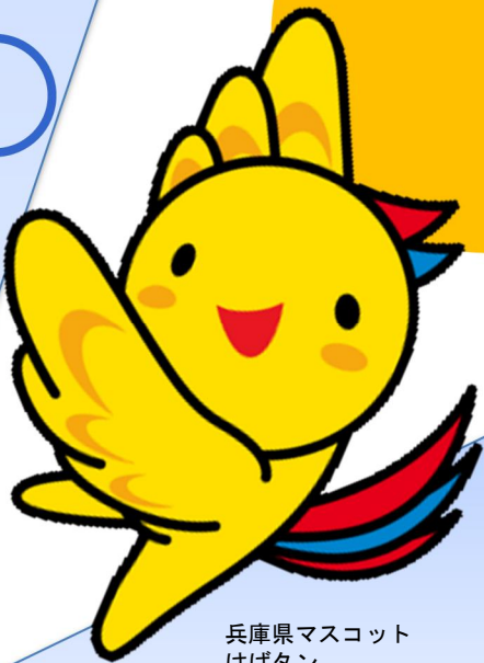
兵庫県マスコット はばタン