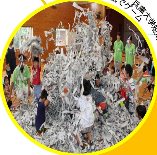
兵庫大学・兵庫短期大学 新聞紙でゲーム

皆様からの寄附を活用し、県内の高校・大学生など、多くの若者のグループ・団体が、被災者の暮らしやまちの復興、励ましなど被災地の復旧・復興を応援する活動を行っています。