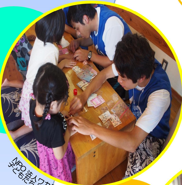
NPO法人ワカモノチカラプロジェクト 子どもたちと折紙

皆様からの寄附を活用し、県内の高校・大学生など、多くの若者のグループ・団体が、被災者の暮らしやまちの復興、励ましなど被災地の復旧・復興を応援する活動を行っています。