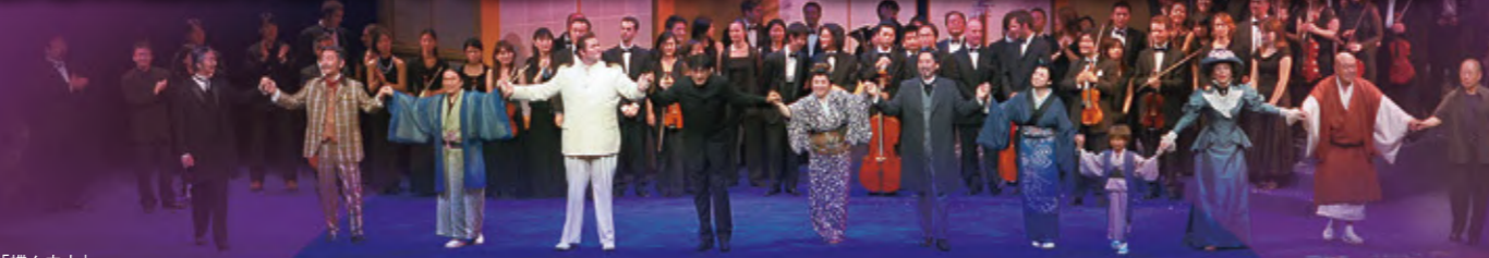
2006年「蝶々夫人」 千種楽カーテンコールより

当時、日本のオペラ界の常識を覆すと話題になった合計8回の 公演は連日喝采に沸き、熱気ある“夏のオペラ”が誕生したのです。