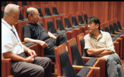
2006年「蝶々夫人」リハーサル中

全8公演 2024 7.12 (金) 13 (土) 14 (日) 15 (月・祝) 17 (水) 18 (木) 20 (土) 21 (日)