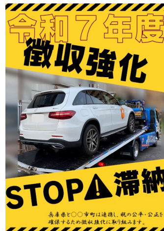
【税収確保重点月間ポスター】

あわせて、県民の納税意識の高揚を図るため、県、市・町、納税貯蓄組合連合会等の広報誌やホームページ等を活用して積極的に広報を行う。