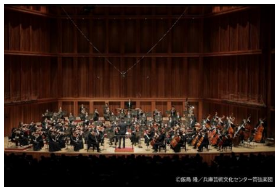
【芸術文化センター管弦楽団】