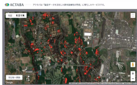
ACTABA による耕作放棄地の視覚化

また、地元農家と協力して、人工衛星による土壌解析データを利用し、肥料を施す時期や量を最適化する技術の導入にも取り組んでいる。