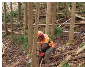
奥地等での間伐作業

宍粟市や養父市など森林が多い市町では、森林管理に係る森林所有者の意向調査や奥地等の条件不利地での間伐等を実施している。