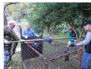
集落住民による罠の設置

県獣害対策チームのもと、モデル集落が拡大しており、宍粟市等では、集落自らが話し合い、柵や罠の設置、点検補修等を行っている。