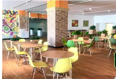
北の街オフィス（淡路市久留麻）

㈱パナソニックグループ（本社：東京都千代田区）は「真に豊かな生き方・働き方」の実現と、BCP対策の一環として、人事・財務経理・経営企画・新規事業開発・グローバル・IT/DX等の本社機能業務を淡路島の拠点に分散させる計画を発表。令和2（2020）年9月から段階的に移転を進め、令和6（2024）年5月までに約