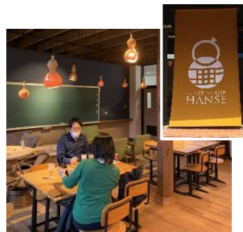
旧小学校を活用したゲストハウス

運営組織をNPO法人化し、改修費確保のためのクラウドファンディングの導入や持続的な事業展開にも取り組んでいる。