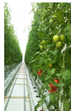
高糖度トマトの生産