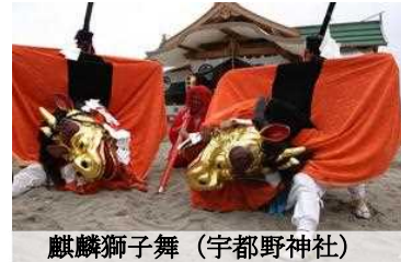
麒麟獅子舞（宇都野神社）

（2019）年には日本遺産にも認定。日本海の厳しい季節を乗り越えたことへの感謝、人々の幸福への願いを象徴する芸能として、今でも愛されている。