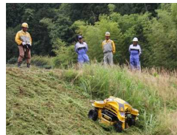
リモコン式草刈機