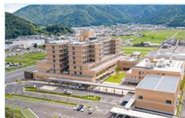
県立丹波医療センター

県では、令和2（2020）年度、県立こども病院と但馬、丹波、淡路の3中核病院に、電子カルテを相互に参照するための地域連携システムとテレビ会議システムを導入。遠方の患者が、地域で診療を継続できるよう、こども病院と中核病院の医師が、協働で診療を行う体制を整備した。