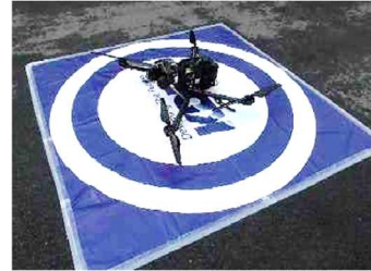
ドローンの利活用

宍粟市の森林資源量調査では、ドローンを約 70km 離れた県庁から遠隔操作し、自治体としてこの分野で全国初のレベル 3 飛行（無人地帯での補助者なし目視外飛行）を実施した。