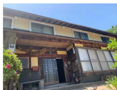
スミノヤゲストハウス

女性移住者が、クラウドファンディングを活用して元民宿を改装し「スミノヤゲストハウス」を開設。宿泊者は、棚田での田植えや稲刈り体験、DIY イベントに参加し、地元住民と交流を深めている。集落人口の4倍を超える交流人口が年間に訪れ、小代ファンを着々と増やしている。