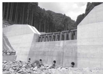
ひょうご式治山ダム(養父市)

また、「第 4 次山地防災・土砂災害対策計画（R3～7）」に基づき、災害に強い森づくりや砂防事業と連携し、治山ダム等の整備を推進している。