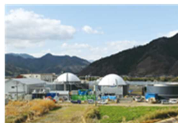
バイオガス発電施設

㈱トーヨー養父バイオエネルギーは、養父市内の畜産農家から出る家畜ふん尿や、食品加工会社から出る食品残渣等をメタン発酵させ、発生したメタンガスを燃料に発電を行い、再生可能エネルギー固定価格買取制度を活用して電力会社へ売電。メタン発酵の副産物は、安価な有機質肥料（液肥、堆肥）として販売して農地に還元し、資源の循環利用に貢献している。