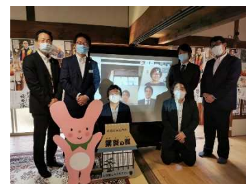
兵庫県地域おこしネットワーク

メンバーの経験、スキルを活かした事業活動を予定しており、地域活性化の人材育成を担う自立自走の団体として期待されている。