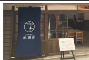
古民家を活用した居場所づくり

NPO等を中心に「子ども食堂」の立ち上げが県内各地で進んでいる。県では「ふるさとひょうご寄附金」を活用して「子ども食堂」の開設を支援。令和3年3月末時点で約2千万円の寄附金額が集まった。