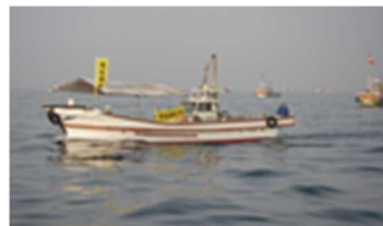
漁業者による海底耕うん

漁業者による海底耕うんの取組が進んでいる。実施後のモニタリング調査では、底生生物の増加や、養殖ノリの色落ちの回復などを確認。令和元（2019）年度からは、より広い海域で実施できるよう「瀬戸内海環境改善海底耕うん事業」を創設し、漁業者グループの取組を支援している。