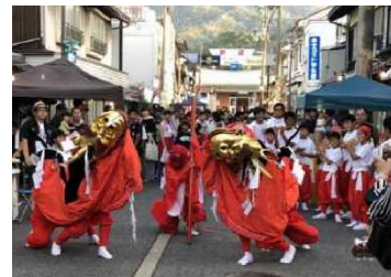
浜坂いきいき納涼祭

県内ではこの他、フリーマーケットや夜市、コンサート等のイベントや、商店街をめぐるスタンプラリーやポイントカード事業、シンボルマスコットの製作等が実施されている。