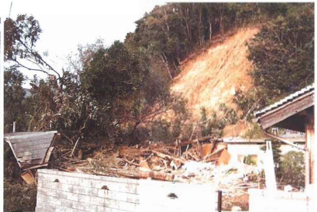
淡路市里（土砂災害により家屋倒壊）