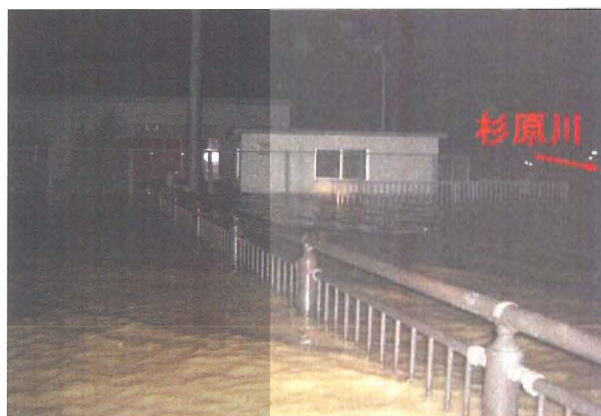
西脇市和田町（浸水状況）