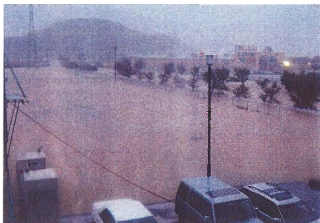
丹波市氷上町横田 浸水状況