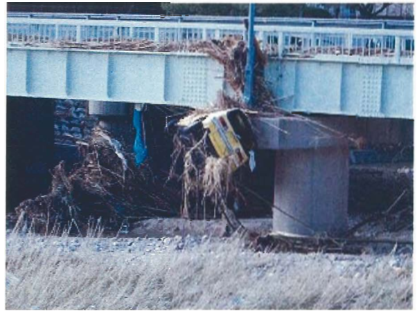
洲本川（洲本市桑間：桑間橋）