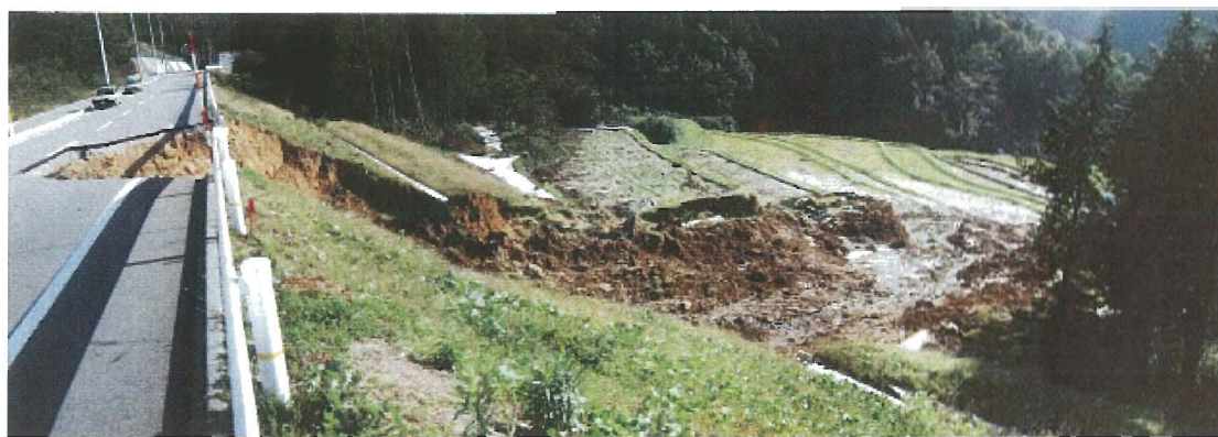
国道477号（川西市黒川）