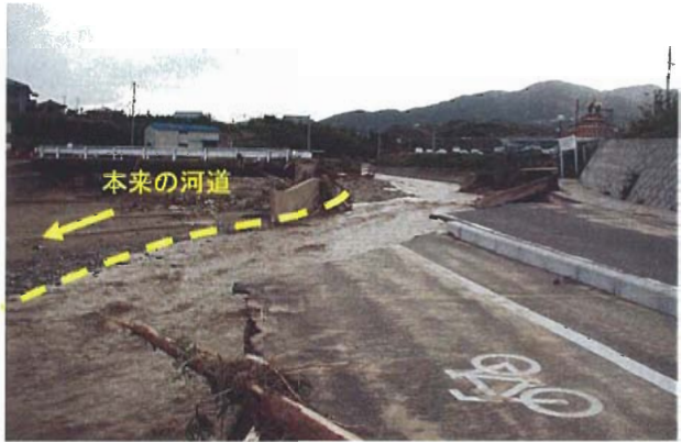
育波川（淡路市育波）