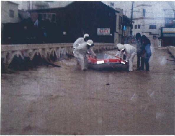
千草川（洲本市物部：常盤橋）