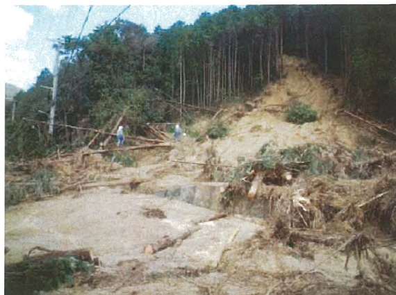
福住三田線（三田市末）