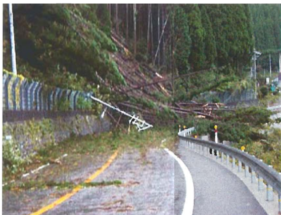
国道29号（波賀町引原～戸倉）