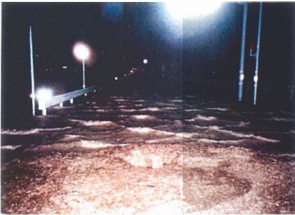
福良江井岩屋線：孫太川（南あわじ市松帆西路）