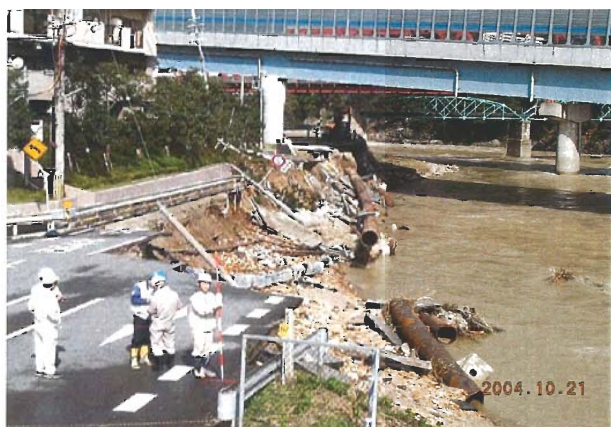
武庫川（生瀬橋：西宮市塩瀬町）