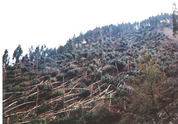
宍粟市千種町河呂（風倒木被害）