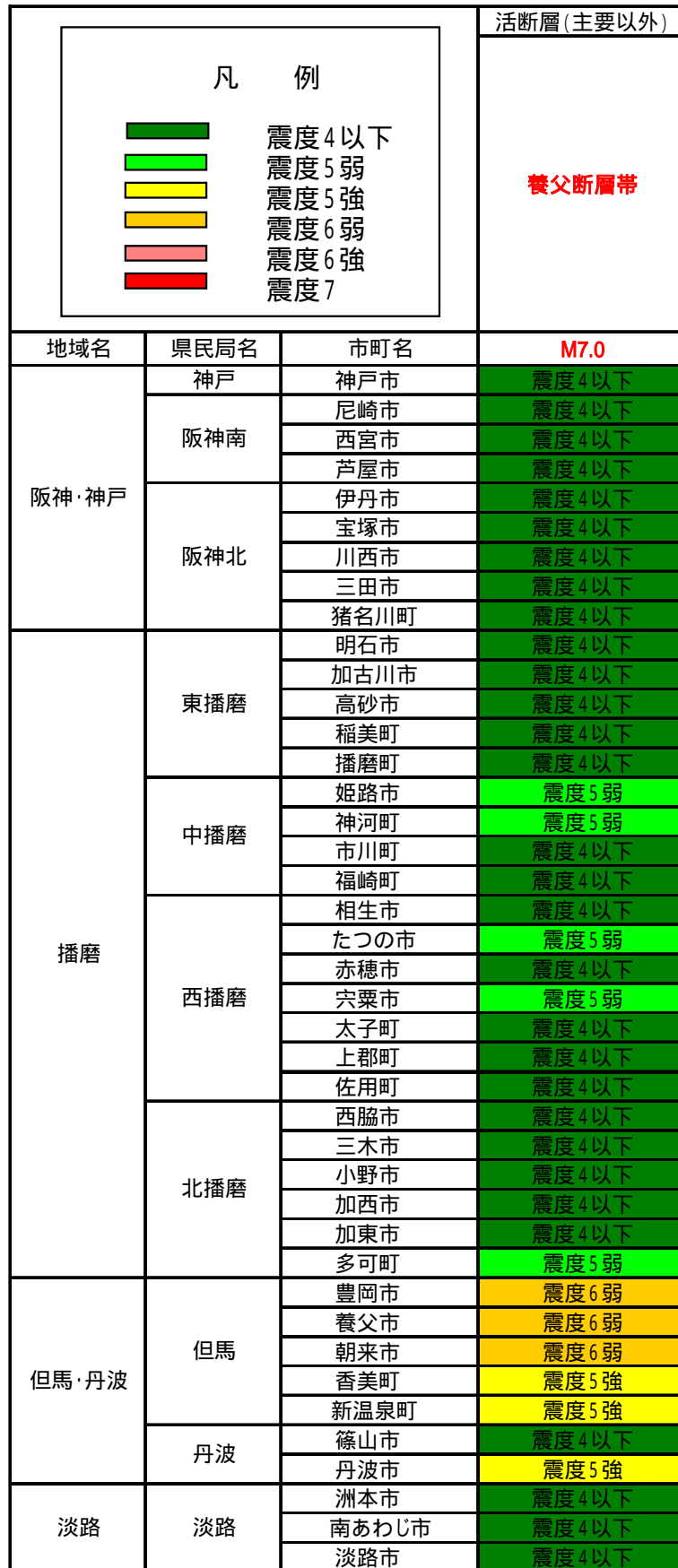
表 1.1.1 市町別最大震度