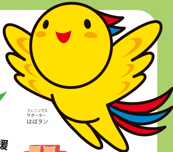
フェニックス サポーター はばタン

フェニックス共済では、これまで半壊以上を給付対象としてきましたが、新たに一部損壊（損害割合10%以上20%未満）を給付対象とする制度（一部損壊特約）が平成26年8月1日からスタートします（加入申込みは4月から受け付けています）。災害への大切な備えとしてぜひ加入の検討をお願いします。