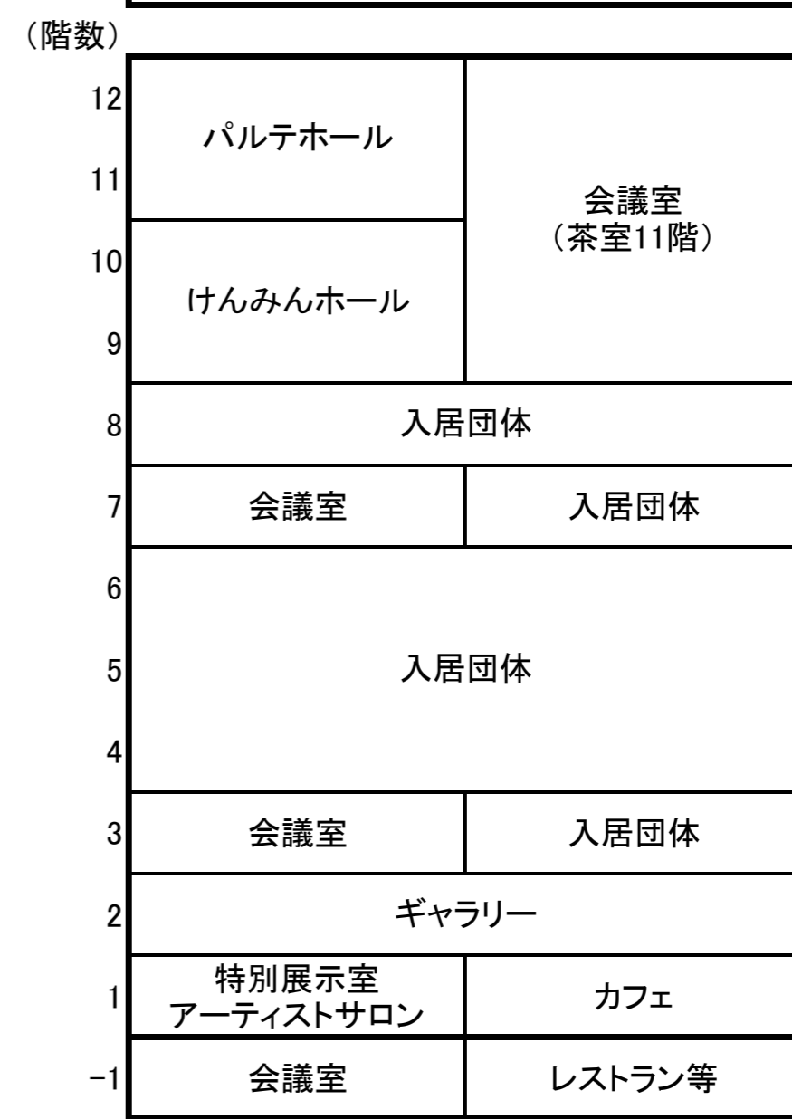
延床面積 15,000㎡ 敷地面積 2,540㎡(駐車場除く)