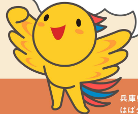
兵庫県マスコット はばタン