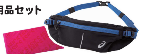
ランニングポーチ/フェイスタオル