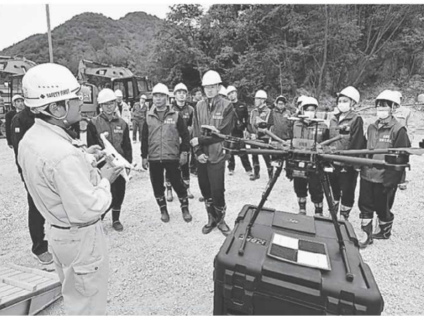
ドローンを使った3次元測量をこの現場で行った技術者がICT技術の魅力を解説

また、この工事ではドローンを活用して測量が行われた。ドローンは地上に目印を付けた範囲を自動航行で立体的に測量。測量データはパソコンで解析したあと、ICT対応のショベルカーに取り込まれ、オペレーターはレバーを引くだけで、ショベルが自動的に掘削する範囲、深さを判断して動く。従来の測量に比べて作業人員が削減できるほか、ショベルカーを動かす際に掘削位置を指示する補助員が要らないため、省力化や安全確保にも