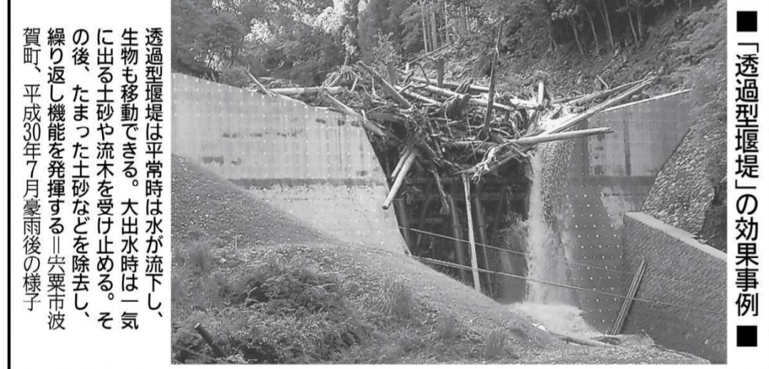
「透過型堰堤」の効果事例

2017年9月にこの会社に転職した。元々は全然違う仕事をしていて、小3の息子がいるので、送り迎えできる時間に出社できる職場を探していた。事務と現場のどちらが良いか聞かれ、体を動かせる「現場」を選んだ。こちらが気に入ると、時間になれば周りの社員が「もう帰る方がいよ」と気にしてくる。土曜、日曜もきちんと休め、建設業に抱いていたイメージが変わった。