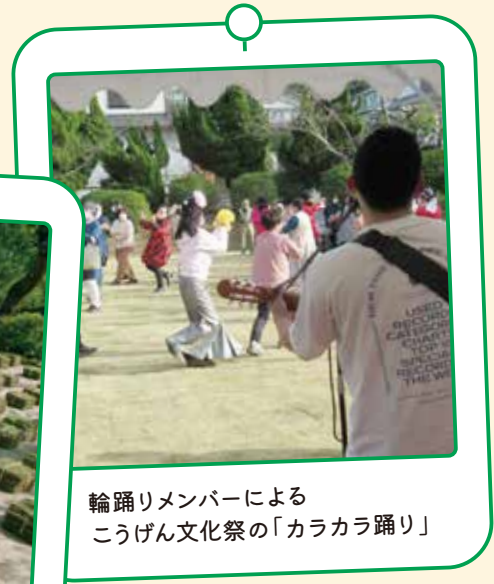
輪踊りメンバーによる こうげん文化祭の「カラカラ踊り」