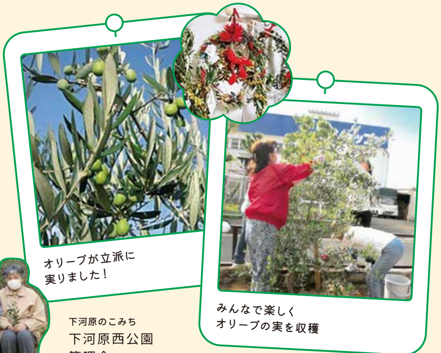
オリーブが立派に 実りました！

都賀川沿いの公園にオリーブの木をたくさん植えました。公園のお掃除にも力が入ります。朝日の中でオリーブの銀葉が道行く人たちに「おはようさん」。繁った葉は捨てないで、ちよっぴり辛い健康茶に。実を集めて塩漬けにもトライ。冬はリースを編んで地域の施設に飾っています。