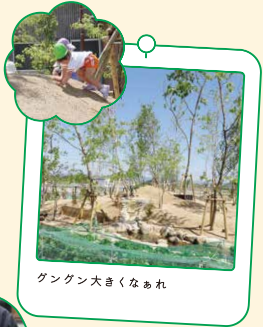
グングン大きくなあれ

“瑠璃こども園 森を作ろうプロジェクト”をスタートし、いずれ小さな森が出来るよう植樹をしました。この地は宮ノ西といい、昔イガキ大明神の社があったと言われています。木々の精霊がまさしくイガキ大明神となってみんなを見守っていただき、鳥や小動物、セミやカブトムシが集まり木々の葉音の心地よい癒しと遊びの森になることを願います。