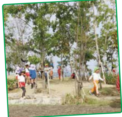
小さな森の可愛い探検隊！