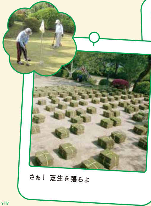
さあ！芝生を張るよ