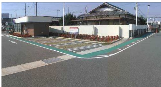
歩行者用通路をカラー塗装し安全面に配慮