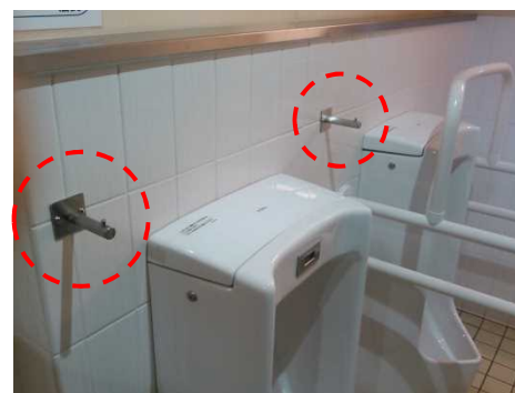
男子用小便器にも荷物用フックを設置