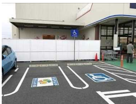
車いす用駐車場に加えて高齢運転者優先駐車場を設置