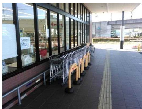
カート等が点字ブロックに干渉しないよう常時配慮