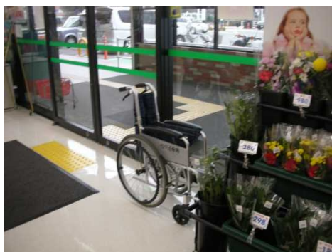
広くて利用しやすい出入口 (車椅子の貸出し有)