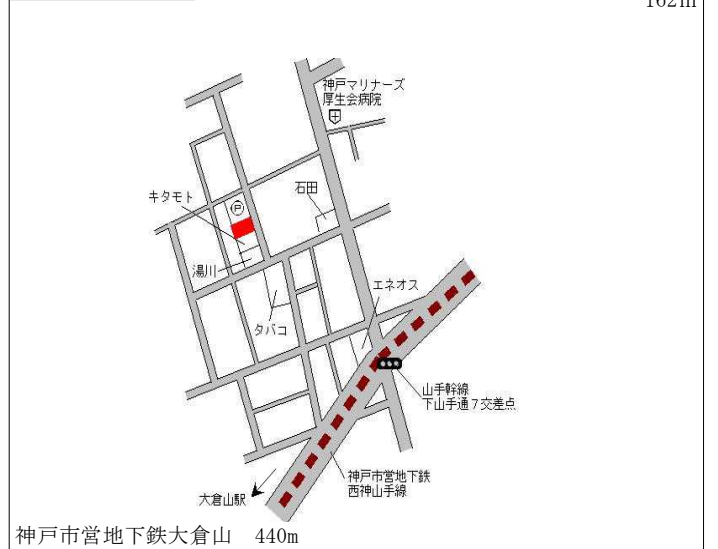
神戸市営地下鉄大倉山 440m

中央(県) - 5 神戸市中央区中山手通7丁目26番 10 「中山手通7-26-17」 347,000円 4.2 % 162㎡