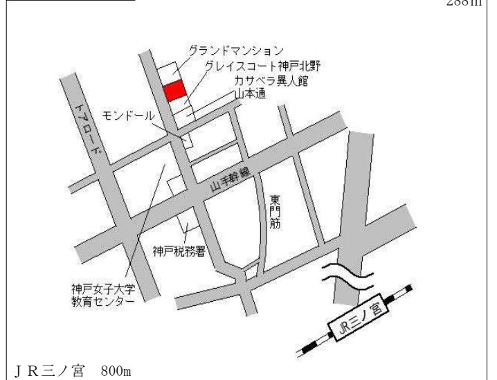
J R三ノ宮 800m

中央(県) - 7 神戸市中央区山本通2丁目6番6 「山本通2-6-10」 485,000円 5.4 % 288㎡ SUMI ALE 山本通