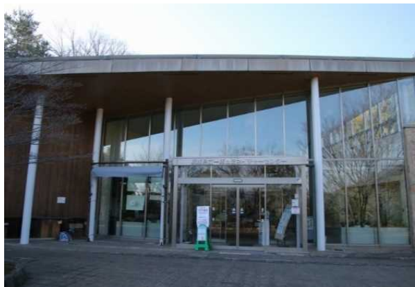
ネイチャーセンター