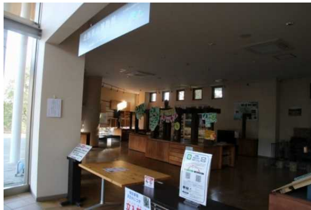
ネイチャーギャラリー