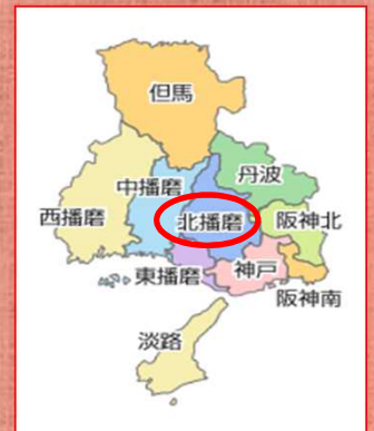
加西北条鉄筋住宅