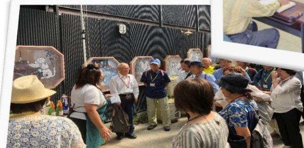
○ 研究のための現地見学の様子（灘菊酒造）