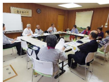
学年全員で意見交換