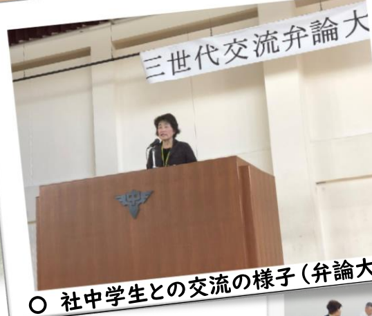
○ 社中学生との交流の様子（弁論大会）