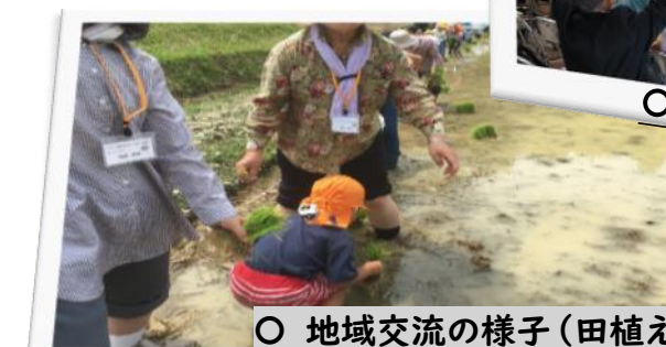
○ 地域交流の様子(田植え)