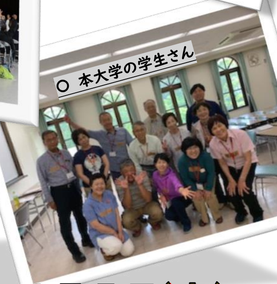
○ 本大学の学生さん