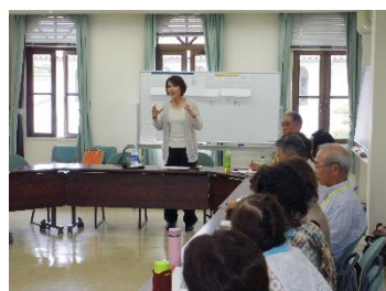
専門家に地域活動入門を学ぶ