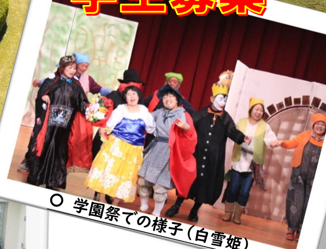
○ 学園祭での様子（白雪姫）