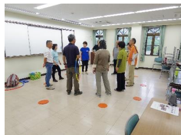
H A P 体験

うれしの学園に入学されますと「うれしの学園生涯大学学友会会則」により全員の方に学友会（自治会）の会員として活動していただきます。学友会では講座の運営や各事業に協力支援を行います。また、学園祭や実践発表会の企画運営、「うれし野の年輪（文集）」の編集発行、支部活動やクラブ活動の企画運営を行います。なお、年会費3,000円（予定）と傷害保険代500円（予定）が別途必要です。※会費は諸事情により変更になる場合があります。