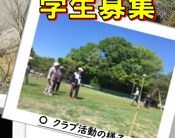
○ クラブ活動の様子