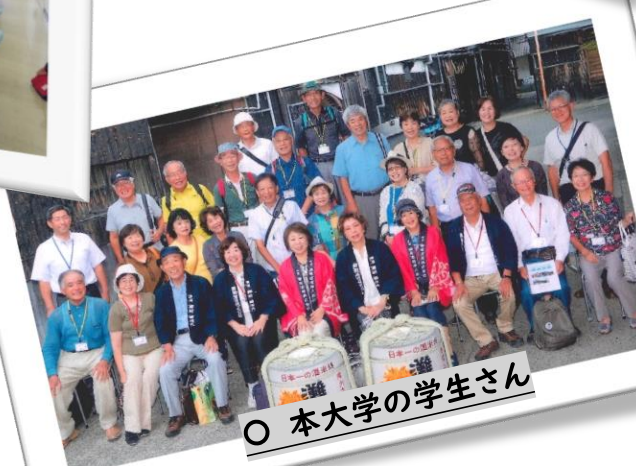
○ 本大学の学生さん